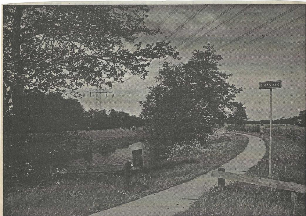
Begin van het fietspad vanaf de Alde Dyk langs de Twijzelervaart richting Twijzel.