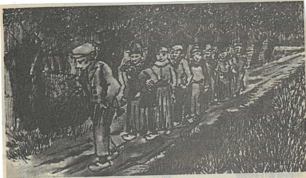
Op het voetpad aan de noordzijde van de Twijzelervaart zijn ouders van kinderen uit de Mieden in het donker op weg naar een ouderavond van de Chr. school in Twijzel. (Tekening Harmen van der Bij)