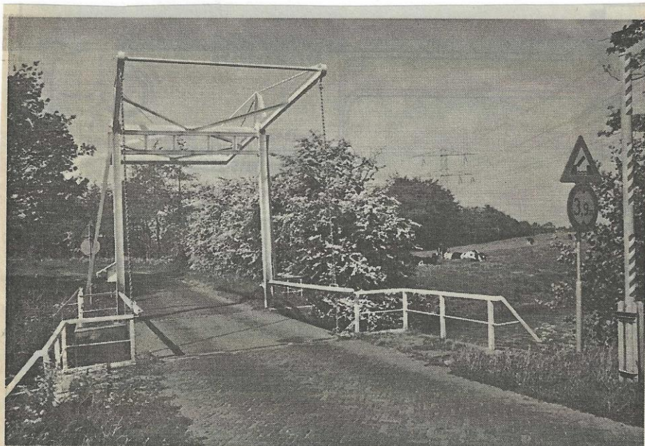
Het 'Twizeler brechje' in de Alde Dyk. Voor de brug rechts begint het fietspad naar Twijzel.

door Dirk R. Wildeboer te Buitenpost secretaris van de Stichting Oud-Achtkarspelen