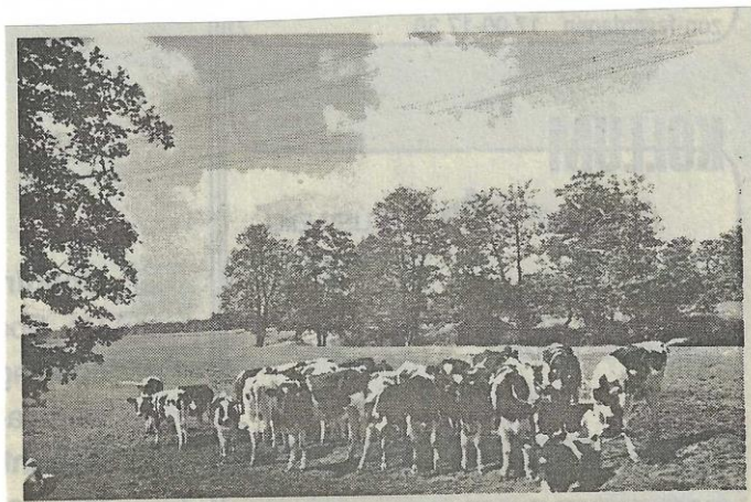
Kalveren aan de Alde Dyk met op de achtergrond de Twijzelervaart.